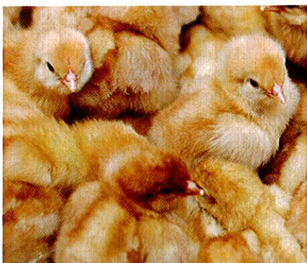
Novogen-kuikens eind augustus in de broederij van Verbeek in Zeewolde