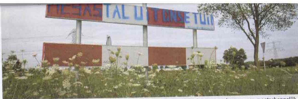
Burgers voelen zich niet erkend en gehoord. Dat is een belangrijke hinderpaal als het gaat om bouwen aan maatschappelijk vertrouwen. Dit leidt tot protesten tegen de bouw van stallen, zoals hier in Wychen in 2011.

Om het maatschappelijk vertrouwen te herstellen moeten achterblijvers en dwarsliggers openlijk